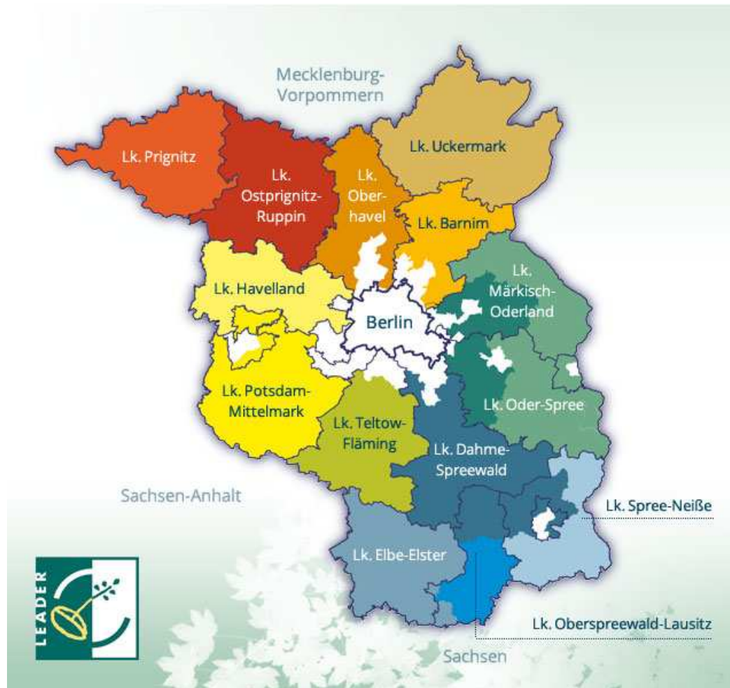
Grafik: Forum Ländlicher Raum Netzwerk Brandenburg